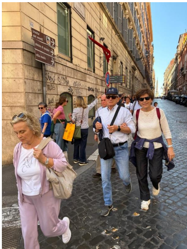
E quando serve... nasce anche la versione con nastro rosso d'artigianato d'emergenza': gruppo 2 per la visita alla Mostra entra in scena!