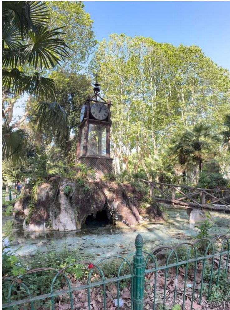
Orologio ad acqua del 1867: il tempo scorre... ma noi cerchiamo di rallentarlo!