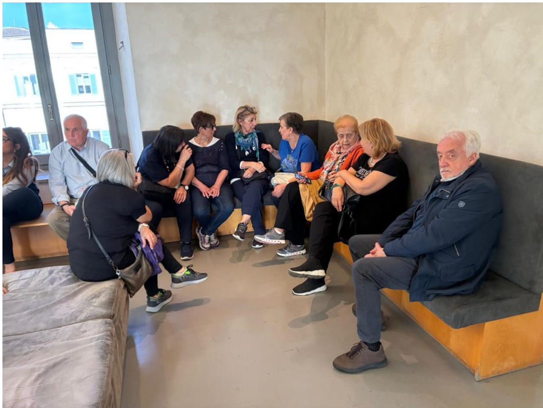
...tra un faraone e l'altro, anche gli esploratori moderni hanno bisogno di una sosta.