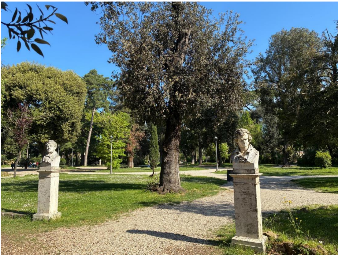
Immersi nel verde dei Giardini di Villa Borghese... finalmente anche i piedi ringraziano.