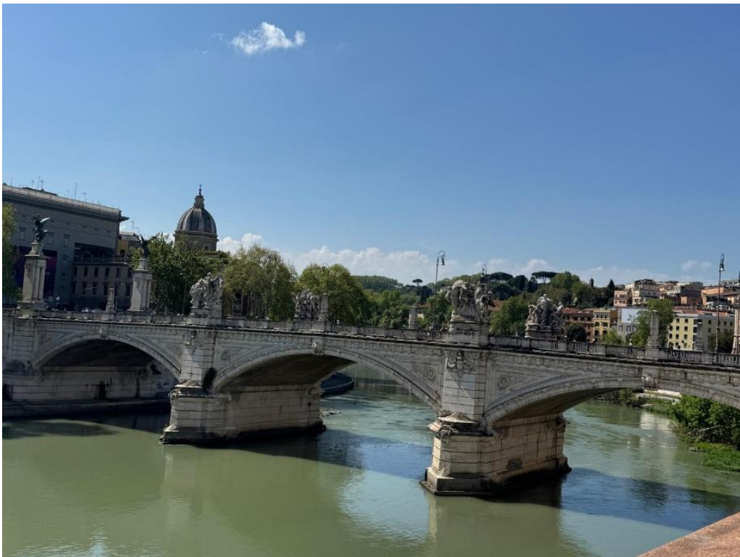
Passeggiata sul Tevere: riflessioni profonde... e foto ancora più profonde