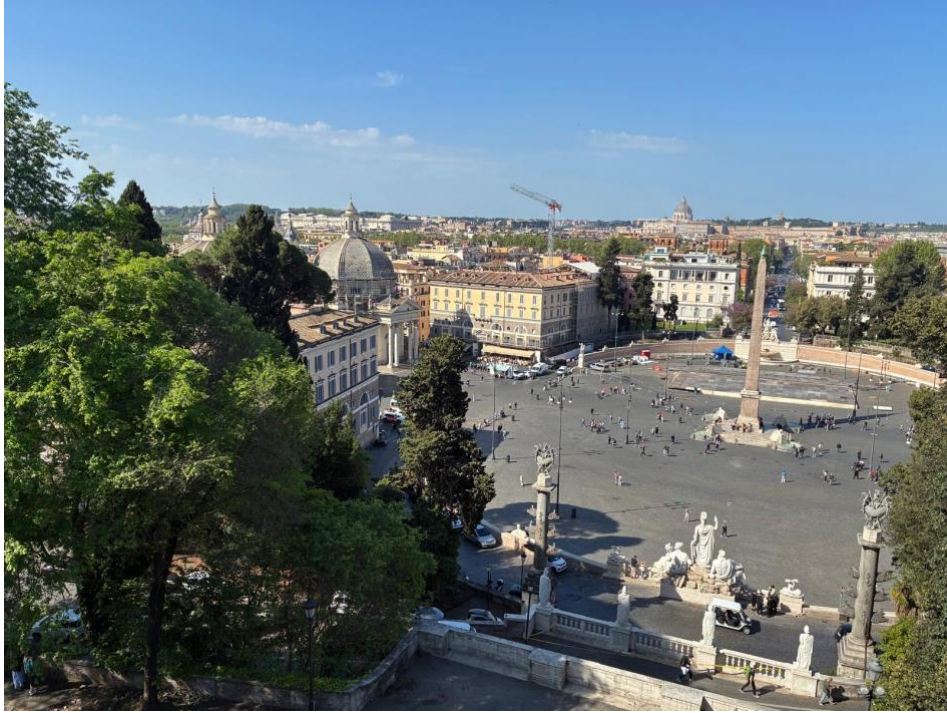
Panorama su Piazza del Popolo: Roma dall'alto... e noi che ci sentiamo (per un attimo) padroni della città.