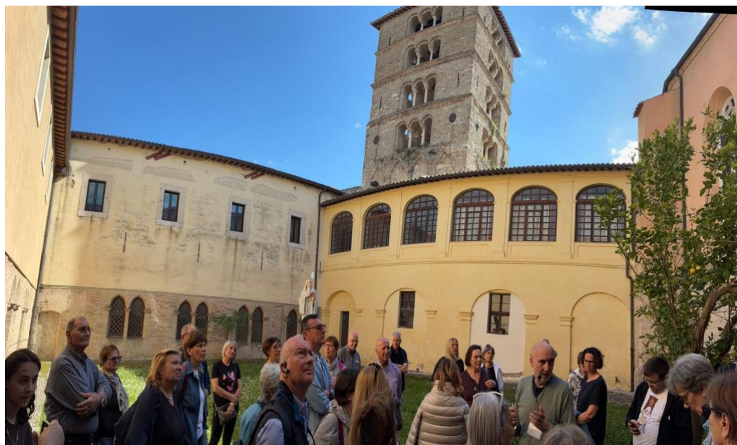
Un luogo che non si visita soltanto... si respira!

Due giorni intensi tra storia millenaria, arte senza tempo e scorci indimenticabili. Ma soprattutto due giorni di condivisione, spensieratezza e scoperta. Il sole ci ha accompagnati, ma è stata la compagnia a rendere speciale ogni momento. Questo racconto in chiave leggera vuole ricordarci proprio questo: che anche tra faraoni, basiliche e abbazie... c'è sempre spazio per un sorriso!