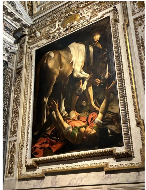
Basilica di Santa Maria del Popolo - Davanti a Caravaggio... cala il silenzio (evento raro ma documentato).