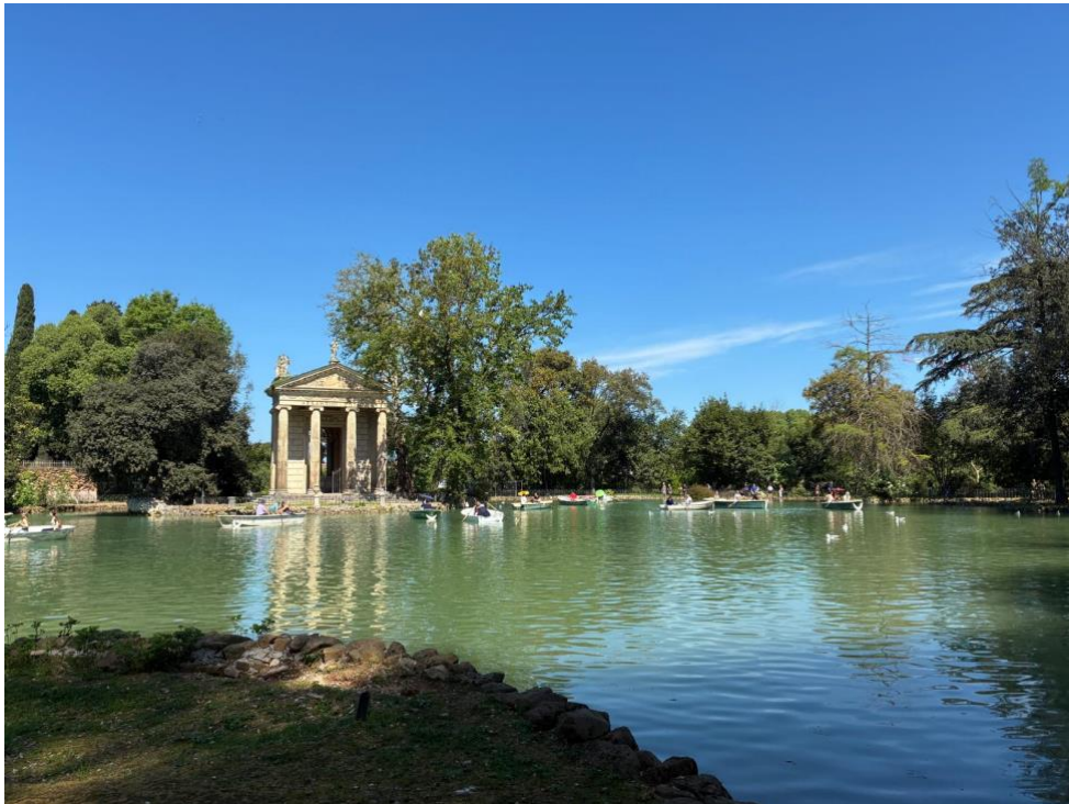
Il Tempio di Esculapio: un po' di salute per tutti... soprattutto dopo la camminata!