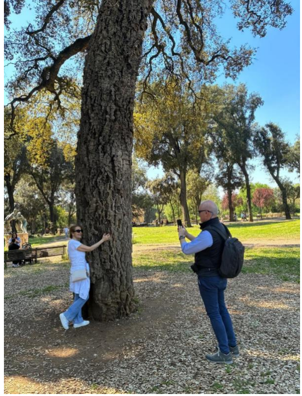
...lui è qui da cent'anni... noi ci fermiamo giusto il tempo di una foto