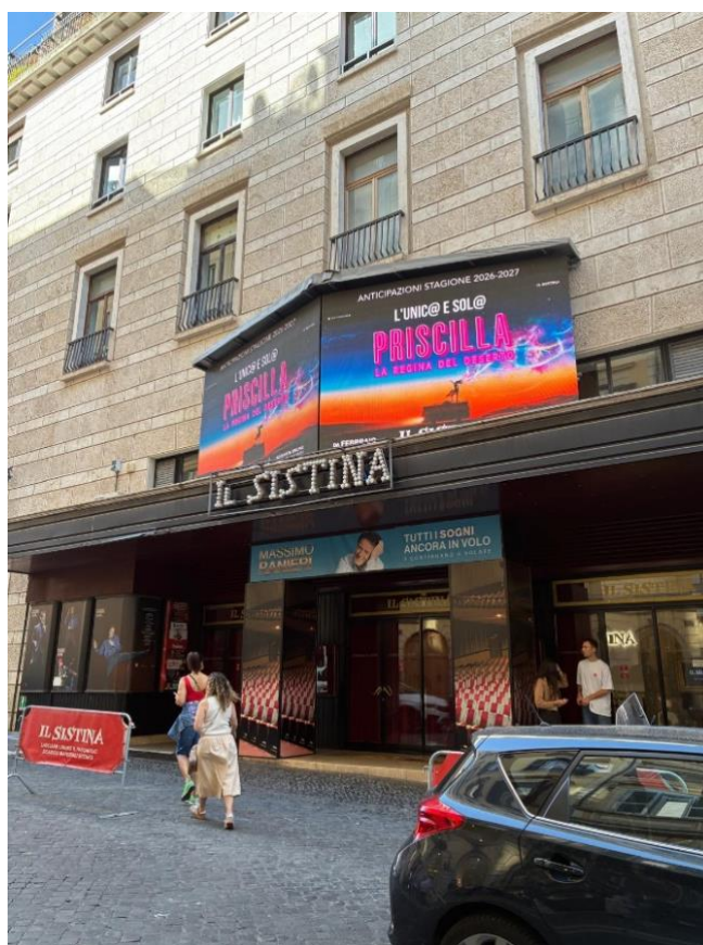
...quando passi davanti al Teatro e senti l'artista che scalpita dentro te.