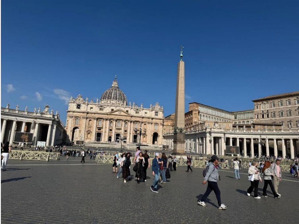
Tra cupole e colonnati... anche il cielo sembra mettersi in posa.