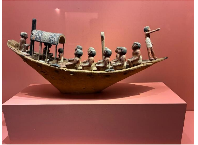
...tra sarcofagi, gioielli e barche: frammenti di un mondo che naviga ancora nel tempo.